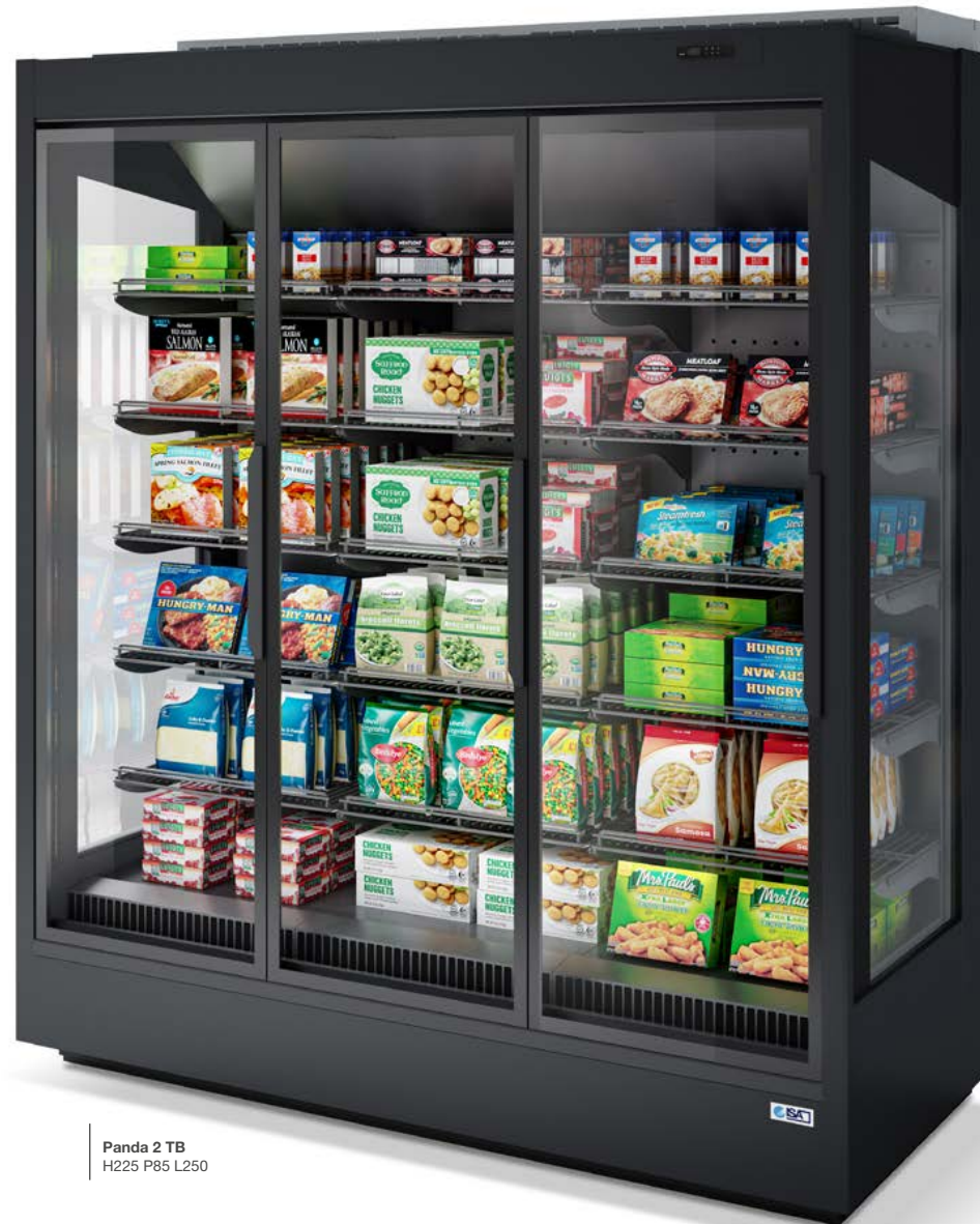
Panda 2 TB H225 P85 L250