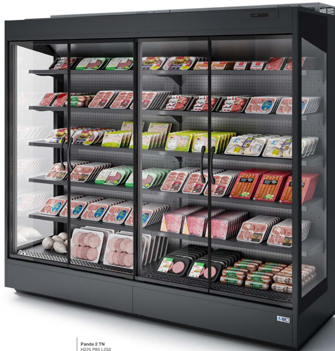
Panda 2 TN H225 P85 L250