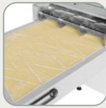
Cutting unit for croissants.

Gruppo di taglio per SFO600X1200E / SFO600X1500E.