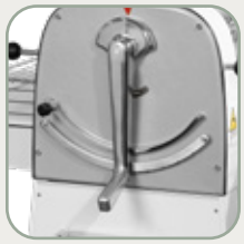
Side guards of aluminium for all models.

Spalle in fusione di alluminio per tutti i modelli.