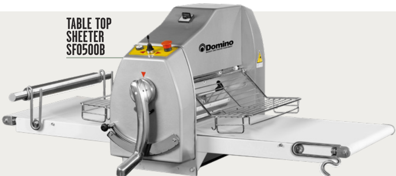
TABLE TOP SHEETER SF0500B