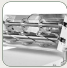
Cutting unit for SFO600X1200E / SFO600X1500E.

Spalle in fusione di alluminio per tutti i modelli.