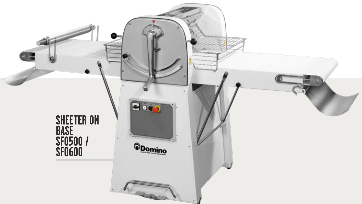
SHEETER ON BASE SF0500 / SF0600